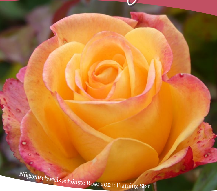
Nöggerschwiels schönste Rose 2021: Flaming Star